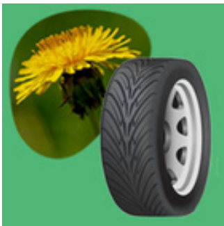
Bilder: Löwenzahn: 5598375 / Pixabay.com / Pixabay-Lizenz Reifen: Vectorpocket / Freepik.com / Freepik License