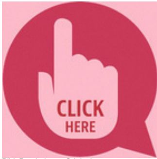
Bild: Bearbeitung, Original-Illustration: Maialisa / needpix.com / Public Domain