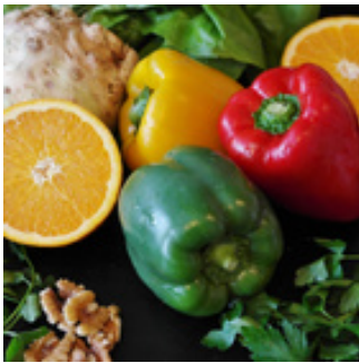
Foto: RitaE [ http://www.umwelt-im-unterricht.de//materialien/unterrichtsvorschlaege/ ] Pixabay.com

[ http://www.umwelt-im-unterricht.de//materialien/unterrichtsvorschlaege/ ] Pixabay Inhaltslizenz