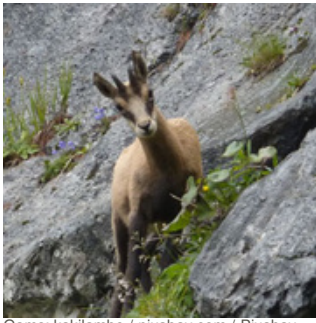
Gams: kakilambe / pixabay.com / Pixabay Lizenz