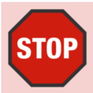
Illustration: Umwelt im Unterricht / CC BY-NC-SA 3.0

Wie und wo wird unsere Kleidung genau produziert? Und was passiert dabei? Das Arbeitsmaterial enthält bebilderte Texte, die einige Stationen vom Weg der Kleidung verdeutlichen. Die Schüler/-innen erhalten den Auftrag, die Stationen der textilen Kette in die richtige Reihenfolge zu bringen. Sie identifizieren mögliche Probleme und entwickeln eigene Lösungsansätze.