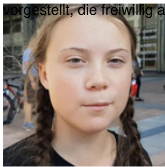
Jan Ainali / commons.wikimedia.org / CC BY-SA 4.0

vorgestellt, die freiwillig aktiv sind – im freiwilligen ökologischen Jahr, in Naturschutzverbänden, in Parteien oder ganz unabhängig mit ihrer ganz eigenen Idee.