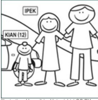
Illustration: Umwelt im Unterricht / CC BY-SA 4.0

Die Arbeitsblätter stellen in kurzen Texten vier Familien und ihre Urlaubsziele vor. Sie enthalten zudem Fragen zum Treibhausgasausstoß verschiedener Verkehrsmittel. Die Schüler/-innen bewerten mithilfe einer Infografik den Treibhausgasausstoß für die vorgestellten Reisen.