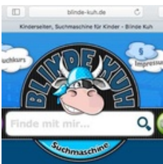
Bild: Blinde Kuh - Die Suchmaschine für Kinder

Die Arbeitsblätter dienen dazu, die Arbeit mit Kindersuchmaschinen zu üben. Sie regen dazu an, verschiedene Ergebnisse zu vergleichen und zu bewerten.