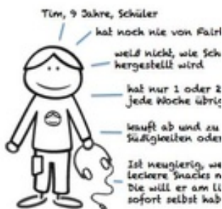
Illustration: Umwelt im Unterricht / CC BY-NC-SA 3.0

Das Material beschreibt die "Persona-Methode" aus dem Marketing. Diese hilft, sich in andere Menschen hineinzuversetzen: Zum Beispiel um diese für nachhaltigen Konsum zu gewinnen. Die Schüler/-innen entwerfen eine eigene Werbestrategie.