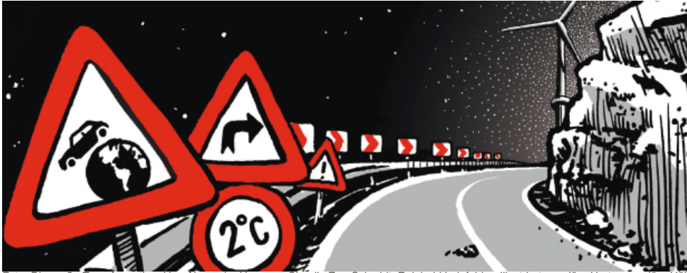
Foto: Die große Transformation. Von Alexandra Hamann, Cláudia Zea-Schmidt, Reinhold Leinfelder. Illustriert von Jörg Hartmann, Jörg Hülsmann, Robert Nippoldt, Studio Nippoldt, Iris Ugurel. © 2013 Jacoby & Stuart, Berlin.

Wie müssen wir heute handeln, um einen lebenswerten Planeten für die nachfolgenden Generationen zu gestalten? Bei den aktuellen globalen Herausforderungen – vor allem beim Klimawandel – geht es darum, heute etwas zu tun, um Probleme in der Zukunft zu begrenzen. Das Wissen und die Technik dafür sind vorhanden. Doch unsere Gesellschaft tut sich schwer damit, langfristig zu denken. Wie lassen sich innovative Lösungen für die Welt von morgen finden – und wie ließe sich der Wandel umsetzen?